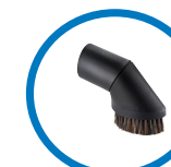
Brosse meuble 107409856