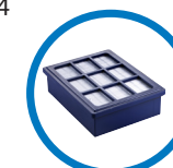
Filtre HEPA 14 107409854