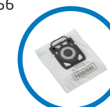
1 sac hygiène inclus