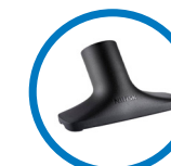
Embout ventouse 107409857