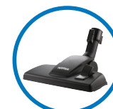
Brosse sols combinée 128389014