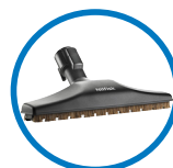
Brosse parquets 107409852